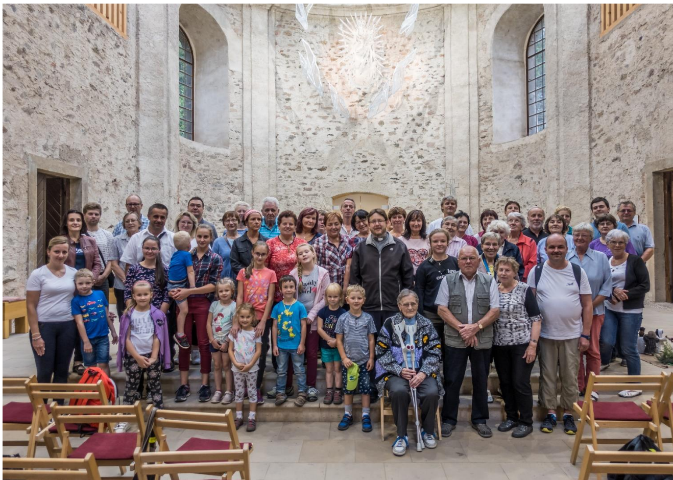
Společná fotografie z farního zájezdu do Neratova v Orlických horách – 5. září 2020