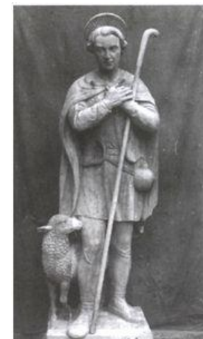
A. Selzer: St. Wendelin, Mödling 1962

Na miniatuře z odpustkové listiny, vydané v Avignonu 4. 4. 1360 pro poutní místo St. Wendel, je vyobrazen jako mnich s knihou, ale i s pastýřskou holí s okovanou špičkou, k němu se obrací o přímluvu jak postavička mnicha zleva, tak postavička poutníka zprava (má poutnický klobouk, poutnickou pelerinu /to slovo ostatně pochází od peregrinus - poutník/ a poutnickou mošnu). Uvnitř tlustých tahů iniciály U jsou obvyklá dekorativní zvířátka středověkých rukopisů: psíci a dráči (drak neměl zpravidla jako dekorace žádný negativní symbolický význam - prostě to bylo jedno ze zvířat, která - jak středověký člověk z tehdejších svých příruček četl - žila někde na okraji kulatého světa v Africe a Asii). Malíř si ještě neodpustil přidat k iniciále kresbičku prasátka se zvonečkem. V tomto případě může jít o nějaký symbolický náznak, protože jak prasátko, tak zvoneček byly atributem svatého Antonína poustevníka. Může to ještě více podtrhovat skutečnost, že svatý Vendelín byl poustevníkem, anebo to může být snad i náznak, že malíř (asi to byl samozřejmě mnich - kdo jiný tehdy uměl psát listiny a malovat iniciály) se jmenoval Antonín. Středověcí malíři a písaři se totiž prakticky nikde nijak jménem nepodepisovali, jen výjimečně to nějak naznačili.